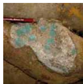
Moisissures vertes sur blessure

Le penicillium provoque des moisissures vertes qui se développent sur des parties blessées des tubercules après la récolte. Un mauvais séchage après un lavage favorise ce champignon.