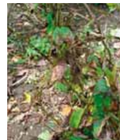
Taches sur feuilles et plante