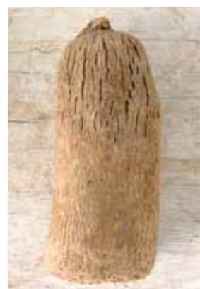
Fentes à la tête d'un tubercule