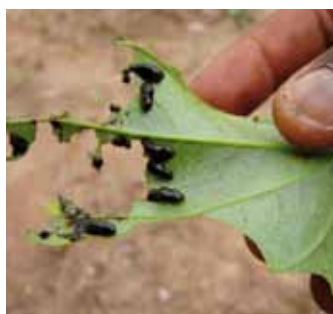
Larves de Crioceris/Lilioceris

Larves, noires brillantes et couvertes de mucus, peuvent atteindre 1 cm. Elles sont défoliatrices. Localement les dégâts peuvent être spectaculaires notamment dans les premiers mois de la culture mais sans réelle incidence économique.